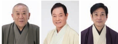
桂ざこば 月亭八方 桂米團治

8月3日(土) ①13:00～ ②17:00～／文化センター 小ホール／ 4,000円(全席指定) ※未就学児の入場はご遠慮ください。 ※5月23日(木) 発売開始 [友の会 5月21日(火)]