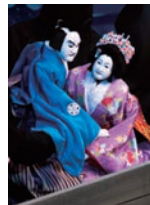
「明石船別れの段」

物語を語る「太夫」、情景を音で表現する「三味線」、一体の人形を三人で遣う「人形」の「三業」がひとつとなり、客席へ感動を伝える「文楽」は、世界に誇る日本の代表的な古典芸能です。公演に先立ち、あらすじを中心とした解説があるほか、字幕付き上演ですのでセリフや状況がわかりやすく、初めて鑑賞される方にもおすすめです。