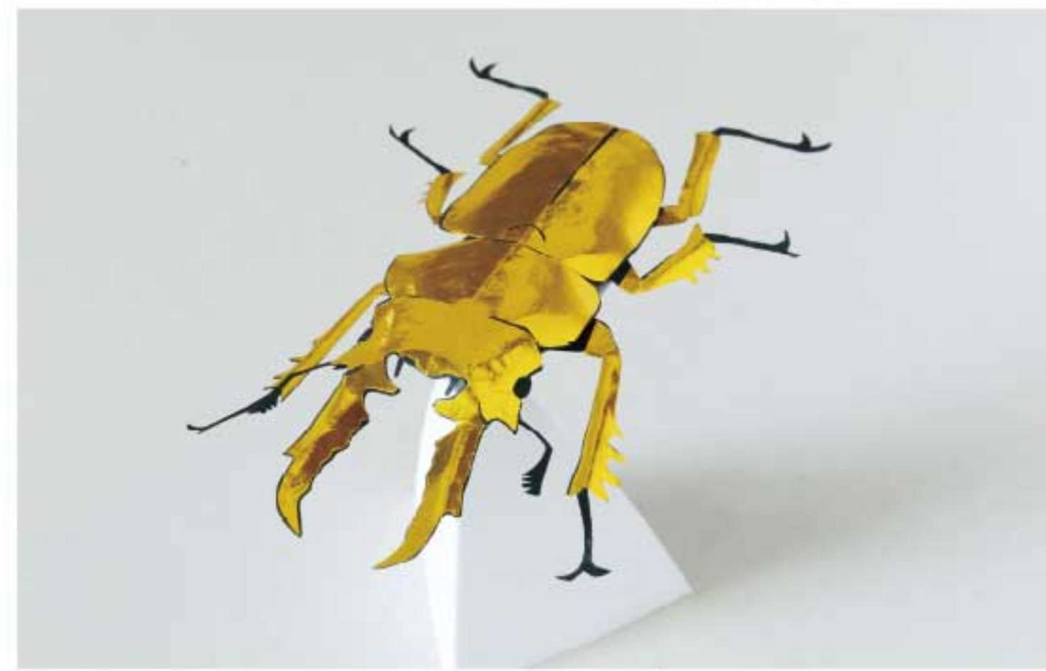
オウゴンオニクワガタ