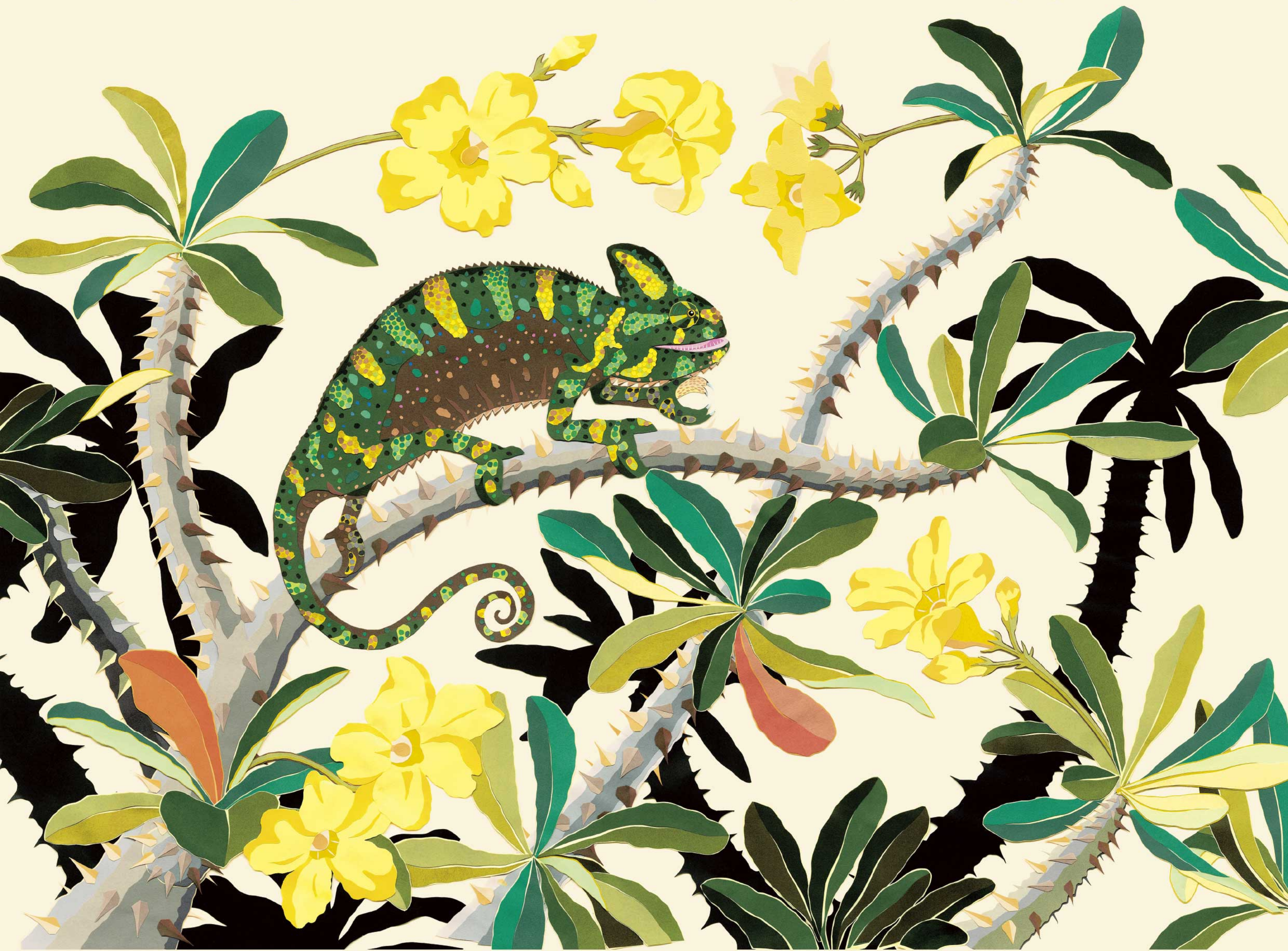
パンサーカメレオンとバキボディウム