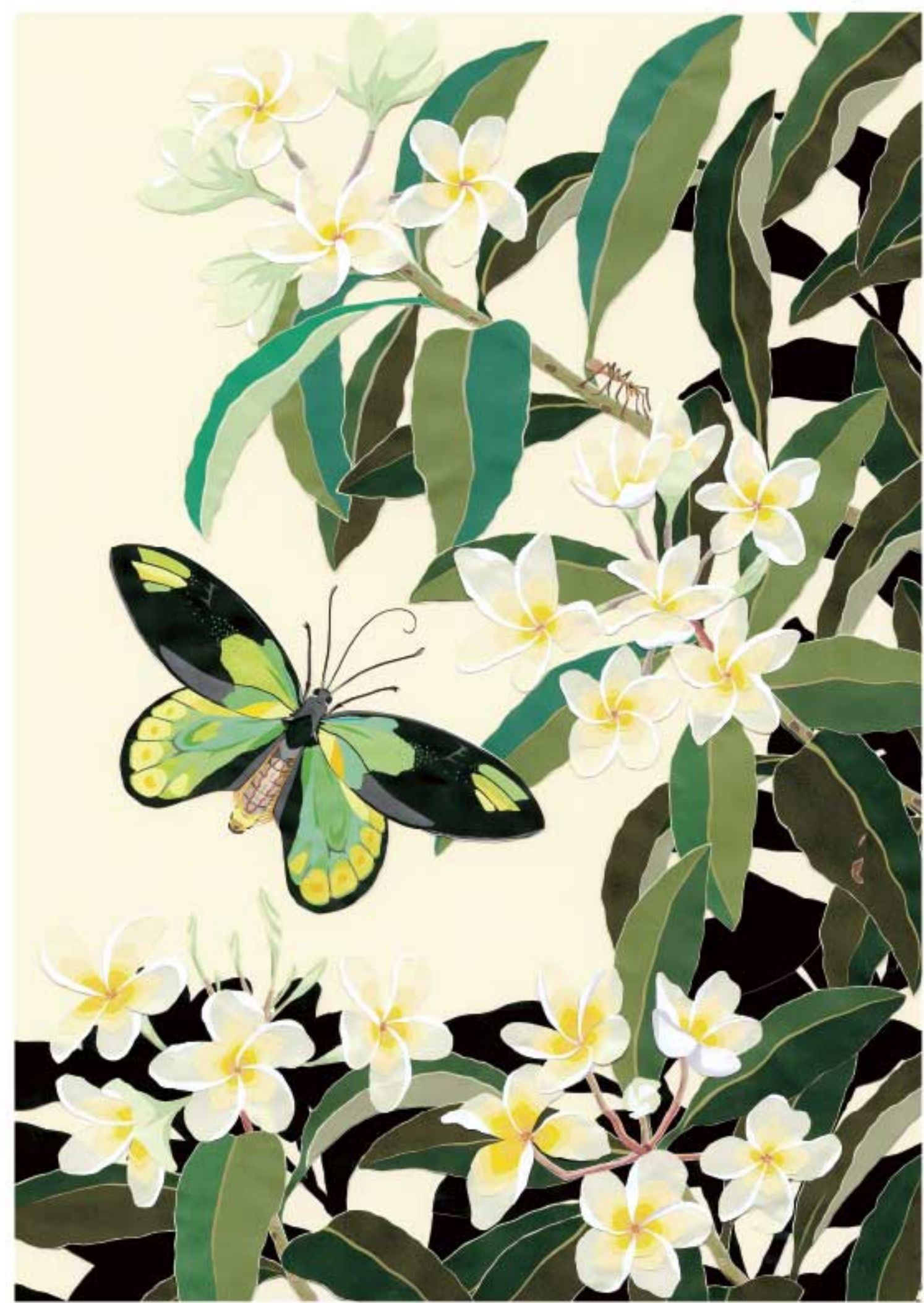
ビクトリアアトリバネアゲハとブルメリア