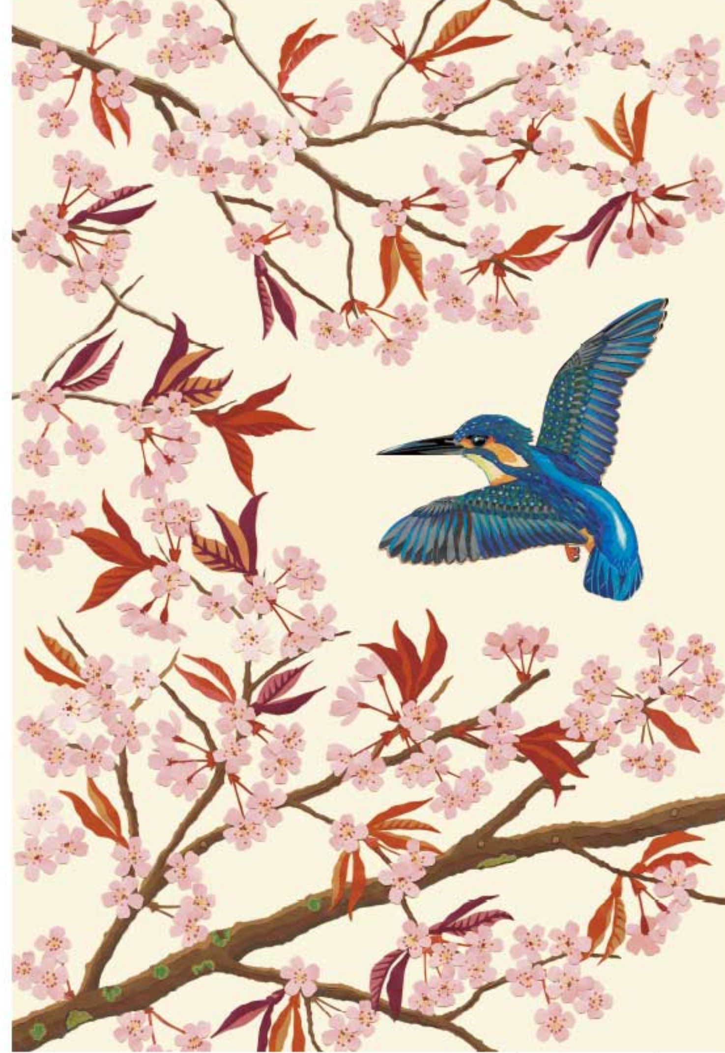
カワセミとヤマザクラ