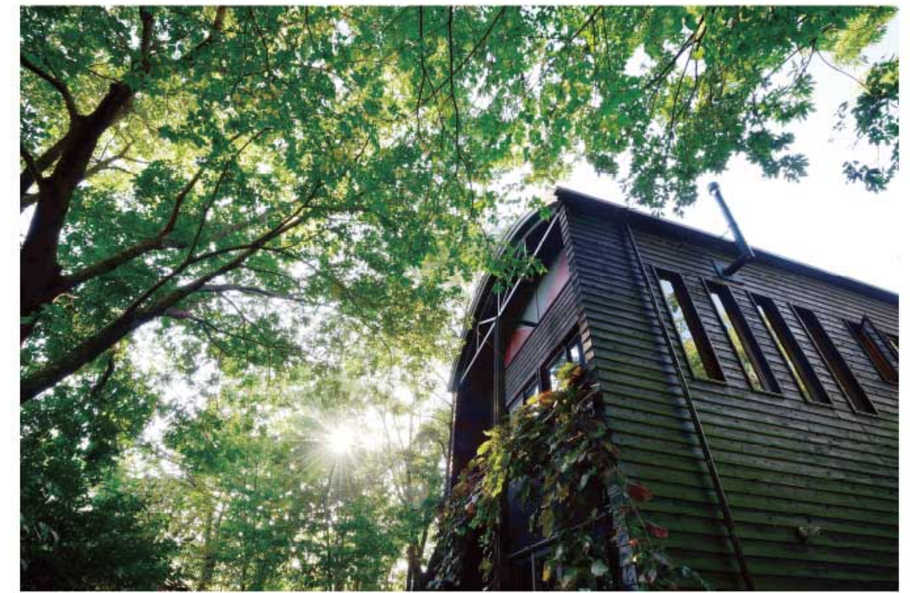
木々に囲まれたアトリエ

1954年滋賀県大津市生まれ。幼少期から身の周りの自然に興味をもち、小川や田んぼでの魚採りや昆虫採集に熱中する。大学卒業後独学で写真技術を学び、1980年よりフリーランスの写真家となる。以後、琵琶湖を望む田園にアトリエを構え、自然と人の関わりを「里山」という概念で追う一方、熱帯雨林から砂漠まで世界各国を訪ね、生物の生態を追求し取材し続ける。第20回木村伊兵衛写真賞、第28回土門拳賞など多数受賞。