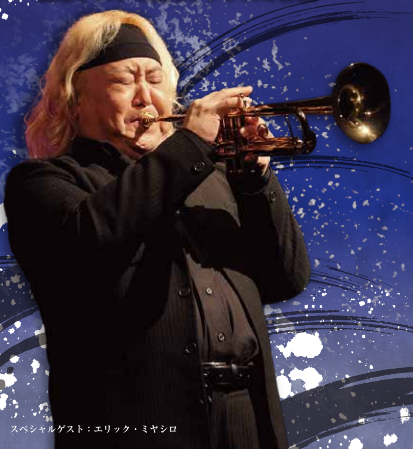
スペシャルゲスト：エリック・ミヤシロ