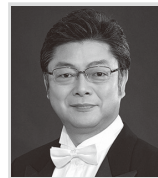
宮本武蔵 井上敏典