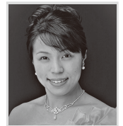
松坂の局 伊藤典芳