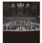
演奏 日本センチュリー 交響楽団