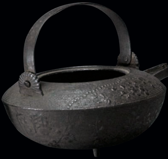
播磨鍋(燗鍋) 芥田家蔵

はりま 播磨の鑄物師 いもじ と鍛冶師 かじし 、郷土の名刀 きょうど と鍛刀の奥義 めいとう