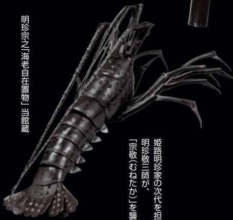
明珍宗之「海老目」在禮物止館蔵