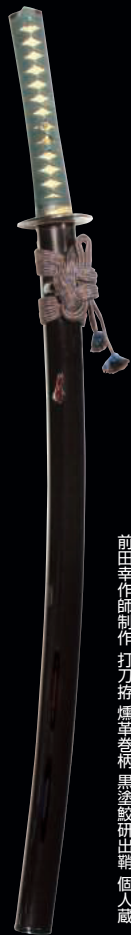
前田孝作師制作 打刀拵 椿椿巻柄 黒漆塗 致研出鞘 個人蔵

野里鑄物師や姫路明珍家の技、矢立や鍔金具といった地元の金工をはじめ、室町時代の大名でもあった赤松政則、明石の吉長(よしなが)、江戸期に活躍した姫路の手柄山門の氏繁、正繁などの兵庫の名刀、たたら製鉄や、今年逝去した姫路の鞘師・前田孝作師をはじめとする職人について紹介します。