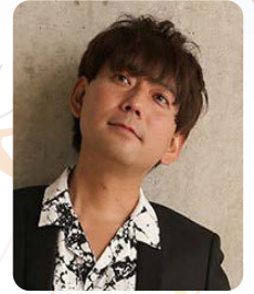
シンガーソングライター TOUMA