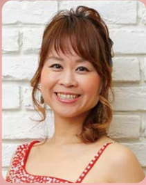
ポップス うしを みやこ