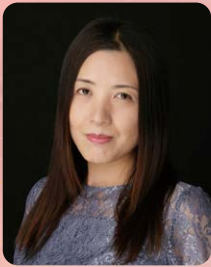
シンガーソングライター 池内 陽子