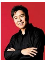
小曾根真