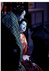
「曾根崎心中」天満屋の段

3月20日(日) 14:00~/アクリエひめじ 中ホール/ 一般 4,000円、高校生以下 2,000円(全席指定)