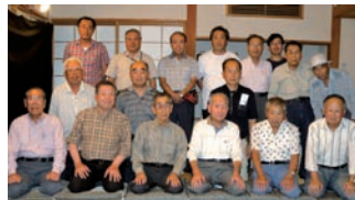
姫路しらさぎ刀剣会(工芸)