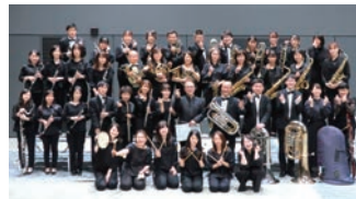
姫路市吹奏楽団(吹奏楽)