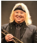
エリック・ミヤシロ

2020年の「姫路レミゼプロジェクト」に参加した、播磨にゆかりのある吹奏楽メンバーが再結集。世界的に有名なトランペット奏者のエリック・ミヤシロをゲストに招き、コンクール課題曲や名曲の数々をお届けします。