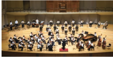
姫路市ジュニアオーケストラ

7月3日(日) 14:00~/アクリエひめじ 大ホール/ 一般 1,000円、高校生以下 500円(全席指定)