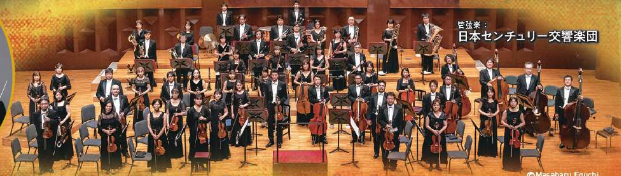
管弦楽: 日本センチュリー交響楽団