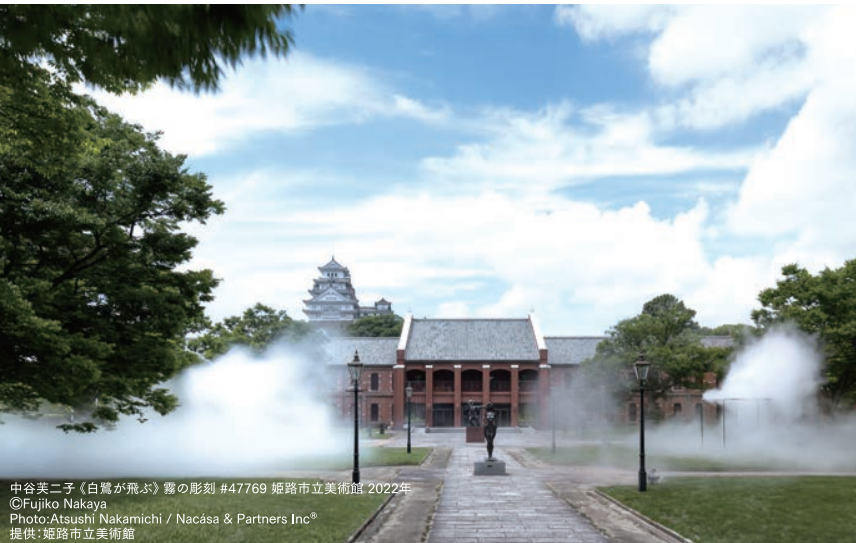
中谷英二子 (白鷺が飛ぶ) 霧の彫刻 #47769 姫路市立美術館 2022年 ©Fujiko Nakaya Photo: Atsushi Nakamichi / Nacasa & Partners Inc. 提供: 姫路市立美術館