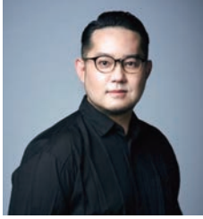
近藤 岳 ©平館 平