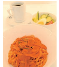
昔ながらのナポリタンセット

柔らかでコクのあるコーヒーが特徴。5種類から選べるモーニング(11:00まで)、スパゲティやサンドイッチなどフードメニューが充実しているほか、企画展ごとのコラボメニューも人気です。季節限定の苺ジュース、ぶどうジュースは絶品!