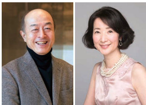
池辺晋一郎