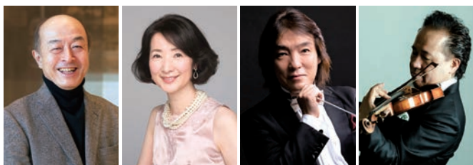
池辺晋一郎 檀ふみ 飯森範親 三浦宏章

世界的作曲家の池辺晋一郎さんが手がけた「独眼竜政宗」「八代将軍 吉宗」のテーマ曲など約10作品を、特別編成のオーケストラ「Legendary Orchestra for Senhime」の演奏でお届けします。池辺さんと檀ふみさんのトーク、特殊な電子楽器「オンド・マルトノ」の音色もお聴き逃しなく。