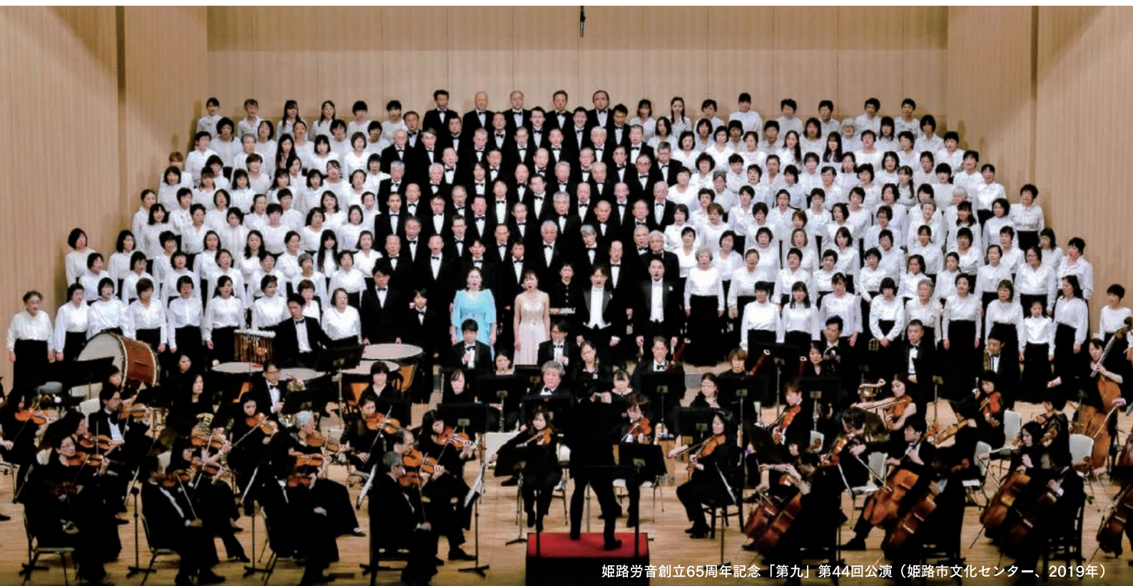
姫路労音創立65周年記念「第九」第44回公演（姫路市文化センター、2019年）