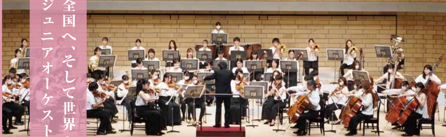
第1回定期演奏会 (2022年7月3日、アクリエひめじ)

「姫路市ジュニアオーケストラ」は、姫路市文化国際交流財団の芸術監督を務める作曲家・池辺晋一郎さんの提唱により2020年8月に結成されました。姫路市で初となるジュニアオーケストラのこれまで、そしてこれからについて紹介します。