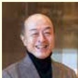
池辺晋一郎

知ればこんなに深く面白く、驚くほど楽しくなる！ 大作曲家のすごさ、素晴らしさに、ぜひ触れてみてください。(A)