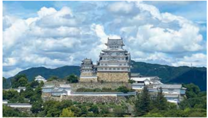
イーグレひめじから眺める姫路城