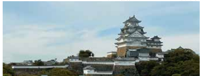
淳心学院から眺める姫路城