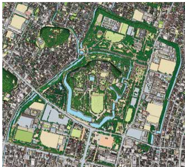
令和の姫路城下 鳥瞰図2021 ©Daisuke AOYAMA

地形図をベースに、右下から左へ、手前から奥へと描き進めるのが基本です。建物は一軒ずつ。街路樹の位置や本数も現状どおりで、樹種を描き分けています。アクリエひめじやはりま姫路総合医療センターは建設工事中でしたので、図面を参考にしました。