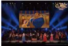
Presentation licensed by Disney Concerts. ©Disney

12.21 ディズニー・オン・クラシック (木) まほうの夜の音楽会 2023 With You ～愛を奏でる 19:00～/大ホール/S席8,900円 ※残席わずか ディズニーの歴史を彩る名曲の 数々を、たっぷりと楽しむ大人 のための音楽会。ディズニー創 立100周年を記念する特別メド レーもお聴き逃しなく。 問 パルナソスホール 079-297-1141