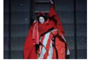
「伊達娘恋緋鹿子 火の見櫓の段」