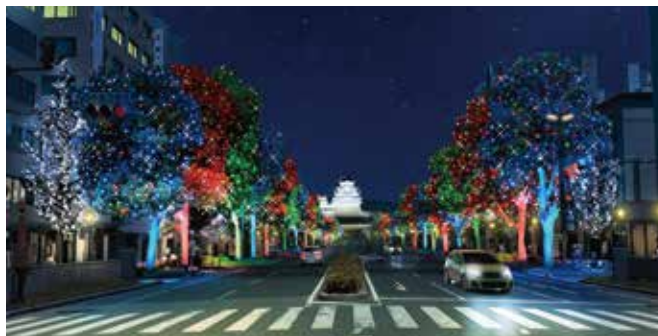
Himeji 大手前通りイルミネーション