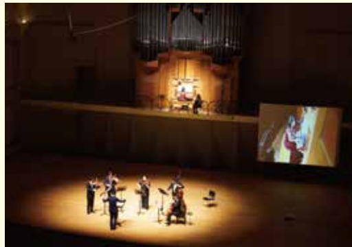
オルガン協奏曲の祭典

2年前のオルガンシリーズで取り上げた「オルガン協奏曲」の分野をさらに掘り下げた第2弾です。弦楽オーケストラとオルガンの共演で、バロック時代のJ.S.バッハやG.F.ヘンデルの作品を中心にお届けします。