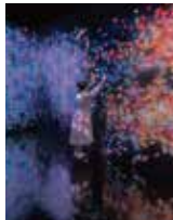
《群蝶、儂い命》©チームラボ

(日) 一般1,500円、高・大生1,100円、小・中生700円 あらゆる境界が取り払われた独自の映像インスタレーションのなかで鑑賞者が自由に動き、没入感を味わい、作品世界との一体感を体験します。