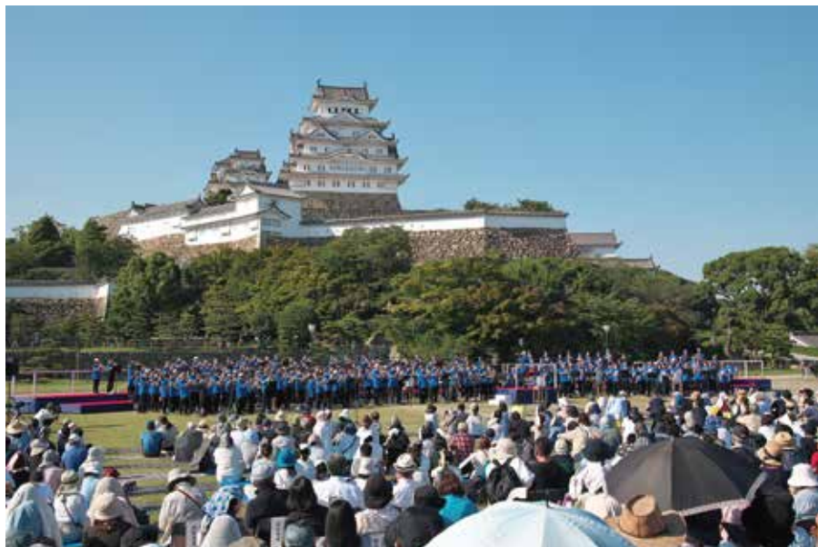
姫路城 100本のトランペット

大手前通りの街路樹やモニュメントを、約22万球のフルカラーLED等できらびやかに装飾する「Himeji 大手前通りイルミネーション」は、来年2月29日(木)まで開催します。姫路城の彩雲ライトアップと連動した一体感のある演出で、夜の姫路を華やかに彩ることでしょう。同期間中は、姫路駅北にぎわい交流広場もイルミネーションで飾られます。