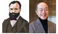
ドヴォルザーク 池辺晋一郎

12.2 池辺晋一郎芸術監督シリーズ (土) 音楽をのぞいてみよう! 第6回 ドヴォルザーク 14:00～16:00/一般2,000円、高校生以下1,000円 池辺晋一郎さん(お話)、糸田麻里絵さ さん(ソプラノ)、村上真璃南さん(チェ ロ)、西岡仁美さん(ピアノ)による オール・ドヴォルザーク・プログラム。 「我が母の教え給いし歌」や「スラヴ舞 曲」他で、大作曲家を大解剖します。 問 パルナソスホール 079-297-1141