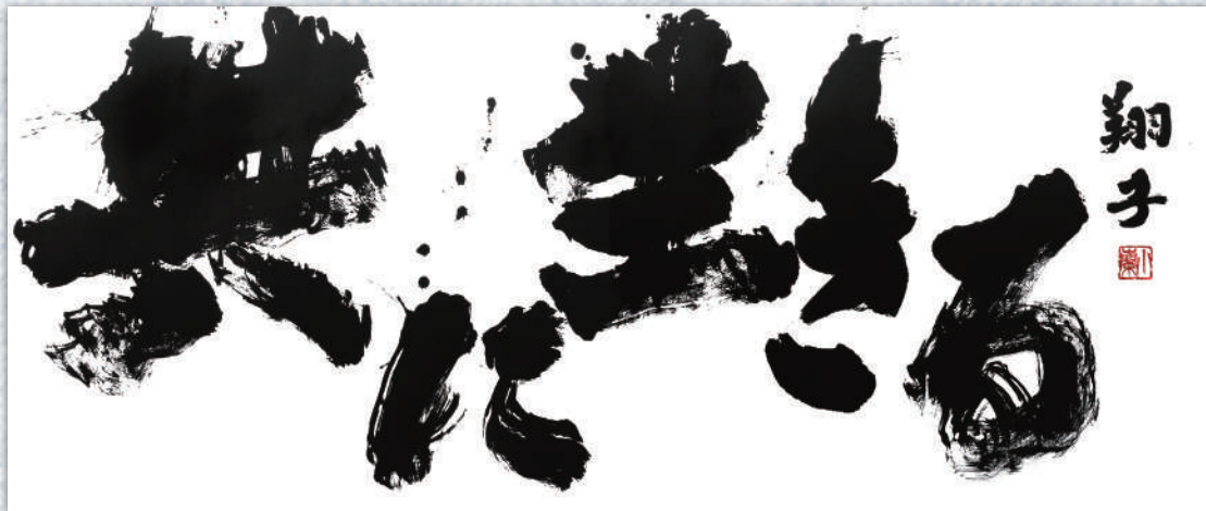
「共に生きる」平成23(2011)年発表