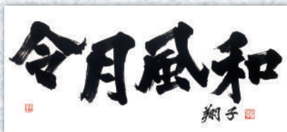
「令月風和」令和2(2020)年発表