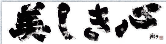
「美しき心」令和2(2020)年発表