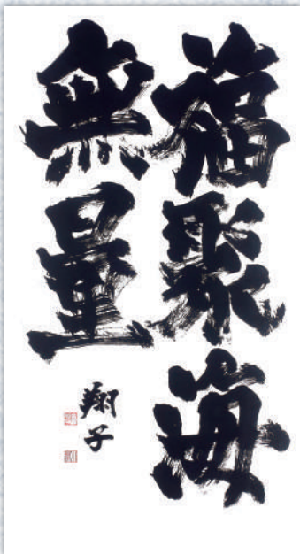
「福聚海無量」令和2(2020)年発表

本展では、「書に親しむ人にも、初めて触れる人にも書を届けたい」との思いを込めて、令和2(2020)年に台湾で開催した展覧会の出品作を中心に紹介します。東日本大震災後に発表した平成の代表作「共に生きる」、東京2020公式アートポスターの金箔原画「翔」などとともに、純粹無垢な魂から生み出される40点余りの大作をご覧ください。