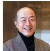
池辺晋一郎

一般2,000円、高校生以下1,000円(全席指定) 一般発売日 4月19日(金) 財団友の会 4月17日(水)