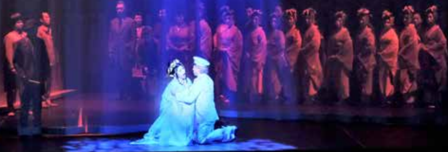
2019年 東京公演より

日本を舞台にしたオペラの名作「蝶々夫人」が、7月にアクリエひめじで上演されます。東京二期会の制作で2019年秋に上演され、その後ドイツ、アメリカでも大成功を収め、今年日本に凱旋、再演されることになりました。