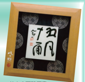
前庭の石碑原書「五風十雨」清水公照墨書

当館は、自然豊かな書写山麓に宮脇檀設計の建物で平成6年（1994年）7月1日に開館し、今年で30年を迎えます。本展ではこれまでに収集した、姫路市生まれの奈良東大寺の僧侶・清水公照の関連作品、工芸(陶芸、染織、漆芸、金工、木工、皮革、ガラスなど)作品、土人形やはりこなどの全国の郷土玩具をあわせた2万3千点あまりの中から厳選した約100点で、作品に込められた雄弁な想いを紹介するとともに、歴代展覧会のポスターや、野鳥写真パネルなどで30年の歴史をたどります。