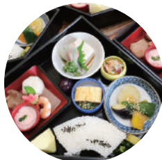
実際の献立とは異なりますので、当日までお楽しみに。