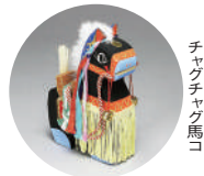
チウケチャク馬こ

姫路市立美術館 ☎079-222-2288 | 姫路文学館 ☎079-293-8228 「プリズム」●4月27日(土)~6月23日(日) | 「大乙嫁語り展」●4月27日(土)~6月23日(日)