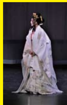
2019年 東京公演より