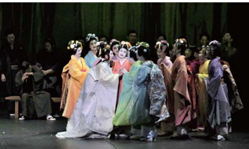
2019年 東京公演より

賢三さんは楽屋で、舞台へ向かう出演者一人ひとりに「がんばって」「がんばって」と声をかけて、笑顔で送り出しておられました。そんな姿を、いま思い浮かべるともう……。2019年の公演のあと、突然に亡くなられてしまって、だから、また今回も絶対に天国から応援しに、観に来てくれるだろうなあ、と思います。