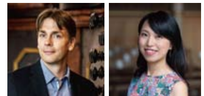
フィリップ・クリスト