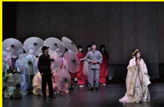
2019年 東京公演より