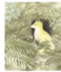
「ごんぎつね」 ©黒井健

日本を代表する絵本作家の一人、黒井健の画業50周年を記念した展覧会。新見南吉『ごんぎつね』『手ぶくろを買いに』の物語世界を情感豊かに描き上げた挿画など、多彩な画業をたどります。