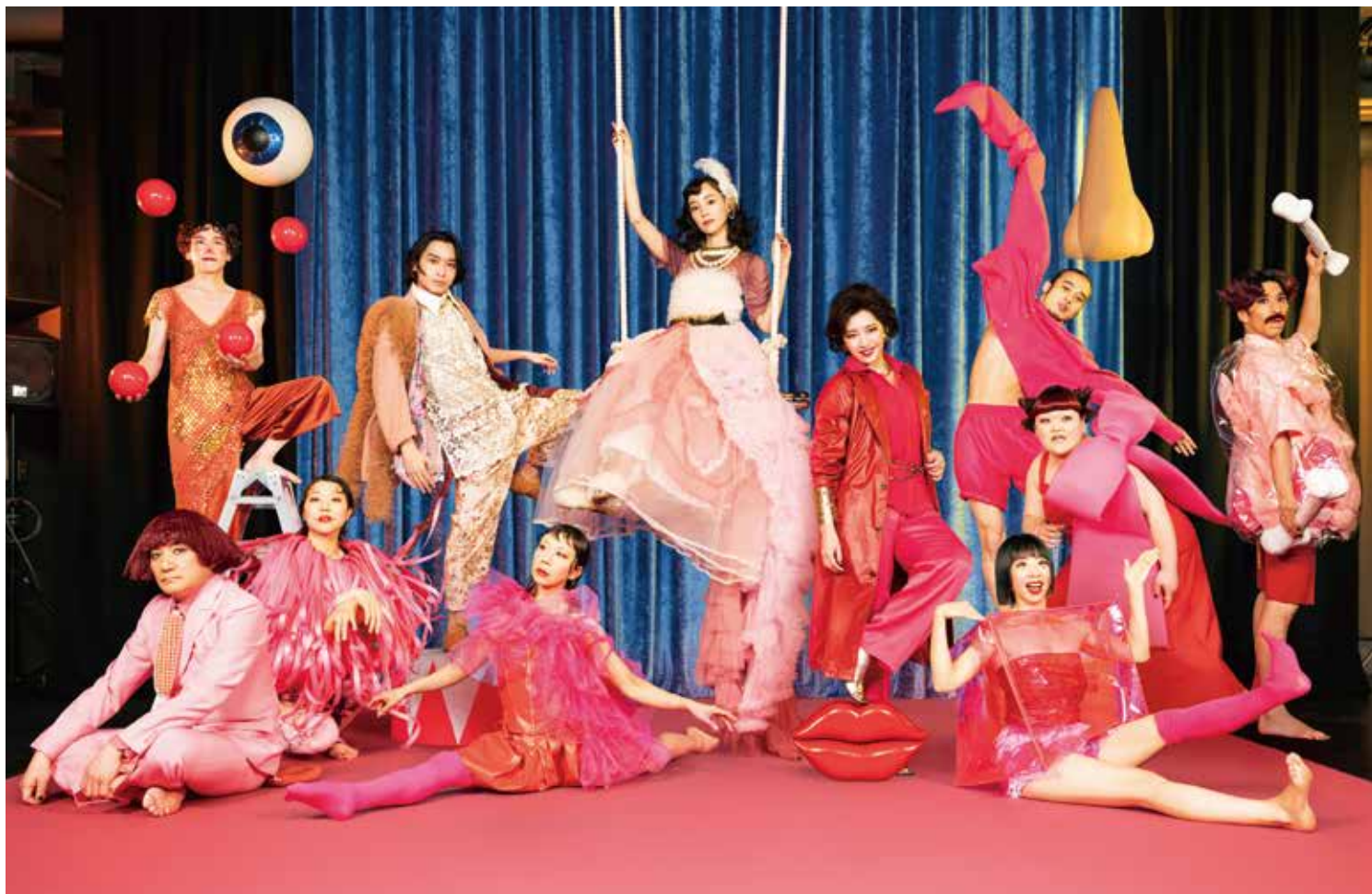
音楽劇「空中ブランコのりのキキ」

“そのサーカスでいちばん人気があったのは、 なんといっても、空中ブランコのりのキキでした。”