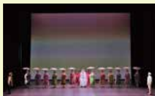
2019年 東京公演より