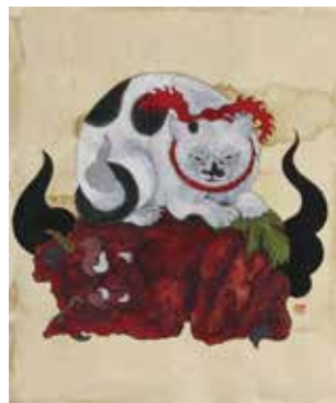
《化け猫天邪鬼成敗絵図 てんまる》 2023年