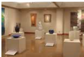
播磨工芸美術展 前回の様子

播磨在住の現代工芸作家グループ「播磨工芸会」メンバーによる陶芸・染織・漆芸・革工芸の新作約30点のほか、公募部門の優秀作品も併せて展示します。会期中には出品作家による「リレー工芸教室」も実施。