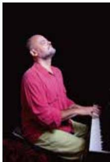
カルロス・アギーレ

現代アルゼンチン音楽家のカルロス・アギーレ(ピアノ、ギター、ヴォーカル)のコンサートです。