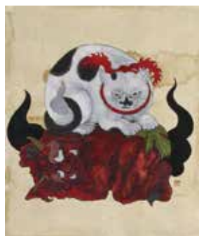
《化け猫天邪鬼 成敗絵図 てんまる》 2023年