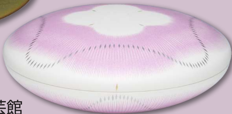
特別賞 [十四代柿右衛門記念賞] 金彩正燕支蓋器 (小山耕一)