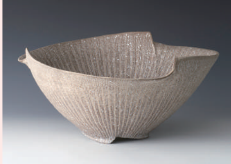
特別賞[インテリア アクア賞] 無名異線紋鉢(六代伊藤赤水)