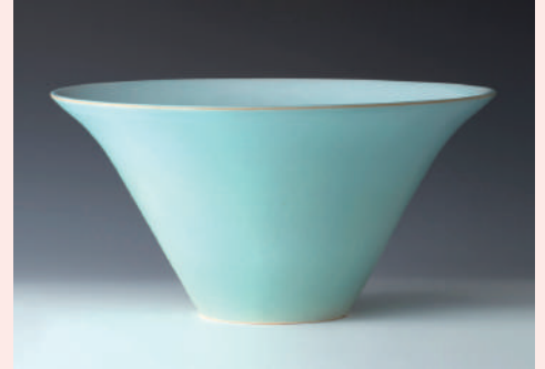
特別賞[茨城交通賞] 淡青釉鉢(岡田泰)